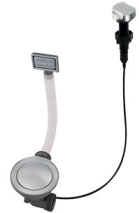
自动下水器 Space - PE 8407 109