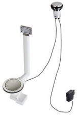
自动下水器 Space - PL 8407 117